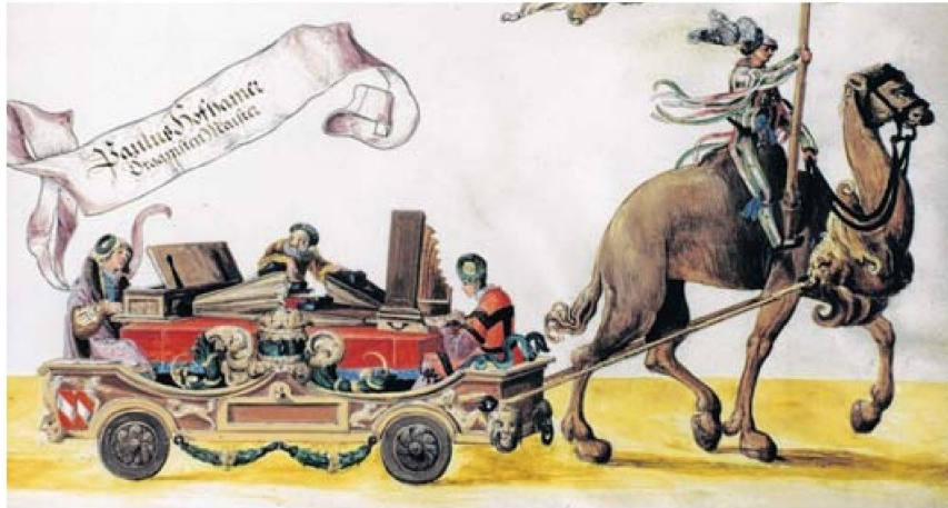
Der Roman führt zurück in die Zeit von Kaiser Maximilian.

➔ VN-INITIATIVE: Lust auf Lesen – Buchtipps